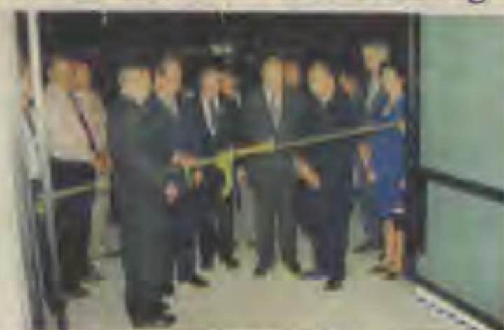
O governador César Borges participou da solenidade de inauguração