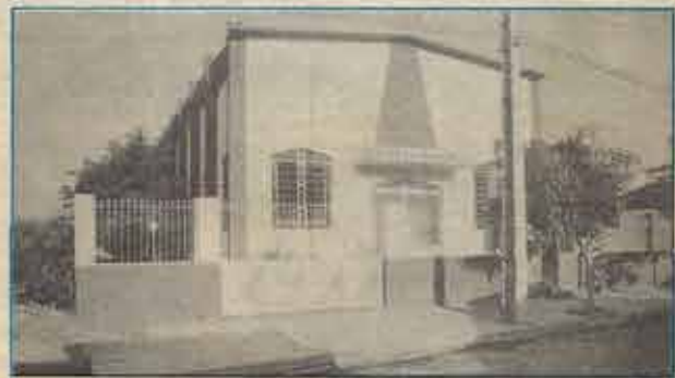
Fachada do Novo Templo da Igreja Batista São (Jequié)

A Igreja Batista São (de Jequié), no dia 7 de Setembro de 1993, dedicou a Deus o seu novo Santuário, com um expressivo CULTO DE GRATIDÃO. Página 4