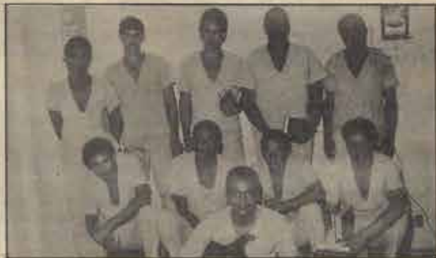
Recém batizados na Penitenciária Lemos de Brito