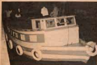
Barco recentemente pintado para o trabalho evangelístico com pescadores.