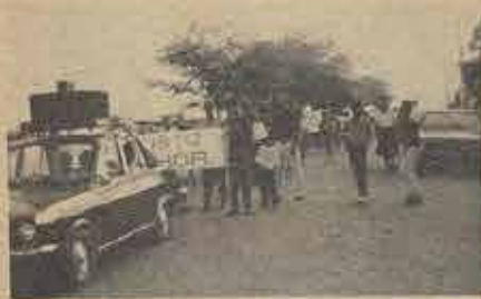
Passeata realizada no dia da organização da 3ª Igreja Evangélica Batista em Juazeiro.