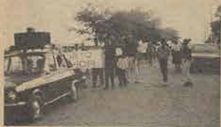
Passeata realizada no dia da organização da 3ª Igreja Evangélica Batista em Juazeiro.