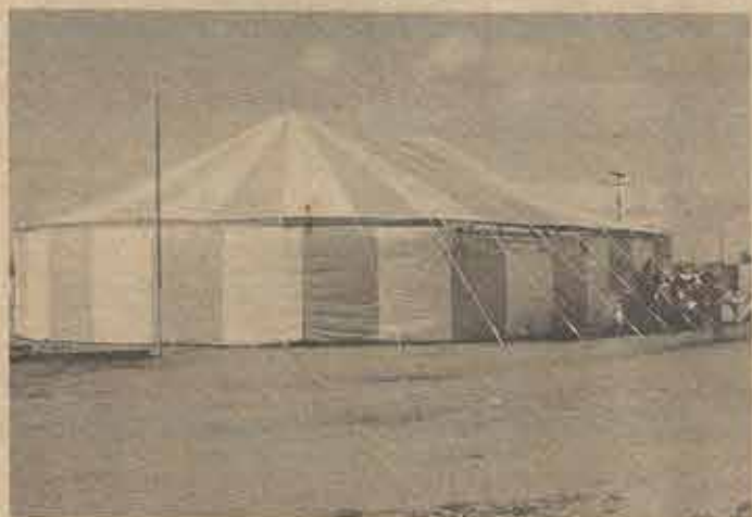
A Tenda da Cruzada Evangélica Uma Nova Esperança realizada em Feira de Santana.

N a última assembléia da nossa Convenção, realizada em Feira de Santana, foi deliberado que para ajudar no custo de impressão de "O Batista Baiano" fosse fixado em cada edição o preço de venda do exemplar. Desta vez, está por Cr$ 1.500,00. Apelamos, pois, aos pastores e demais líderes de nossas Igrejas que vendam e enviem Cr$ 900,00 (novecentos cruzeiros) para a Junta Executiva da Convenção Batista Baiana.