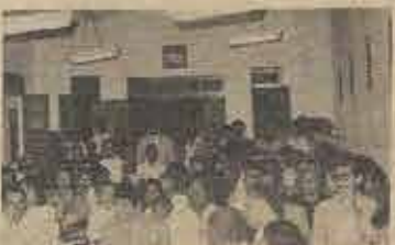
Participantes do Culto de organização da 1ª Igreja Batista em Teodoro Sampaio, junto aos membros fundadores da referida Igreja.