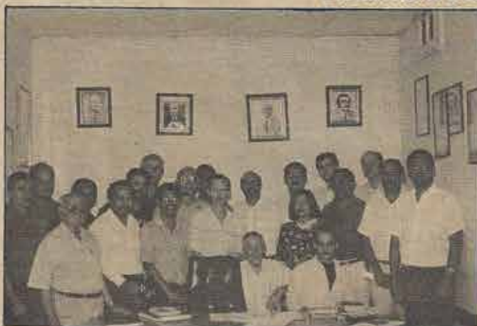
Membros e assessores da Junta Executiva da Convenção Batista Baiana