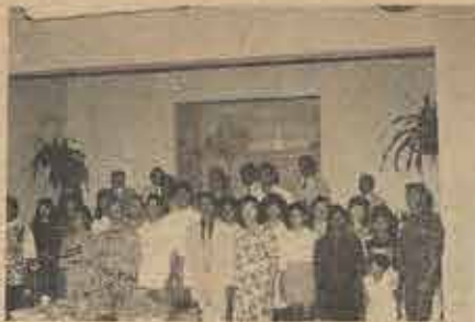
Membros fundadores da Igreja Batista da Graça, organizada pela Igreja B. da Várzea, no dia 16/8/92.