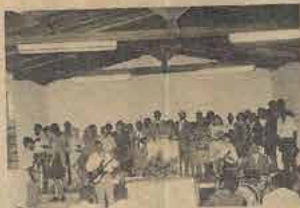
Membros fundadores da 3ª Igreja Batista em Juazeiro organizada no dia 29/8/92