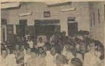
Participantes do Culto de organização da 1ª Igreja Batista em Teodoro Sampaio, junto aos membros fundadores da referida Igreja.