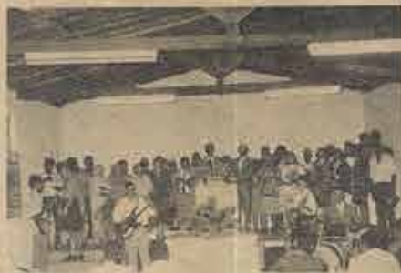
Membros fundadores da 3ª Igreja E. Batista em Juazeiro organizada no dia 29/8/92.