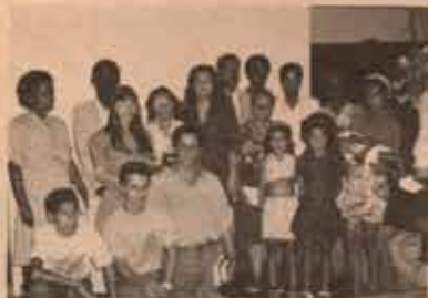
Membros da Frente Missionária entre Pescadores.