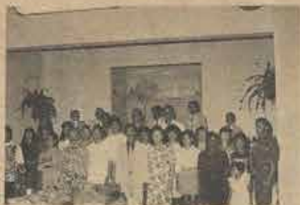
Membros fundadores da Igreja Batista da Graça, organizada pela Igreja B. da Várzea, no dia 16/8/92.