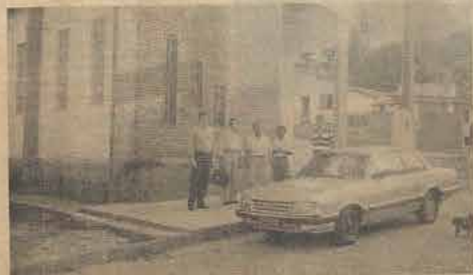
Templo da 1ª Igreja Batista em Mundo Novo