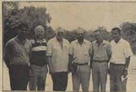
vereiro de 1992. Aguardem informações sobre o programa.

A Ordem dos Ministros Batistas do Estado da Bahia terá o seu Retiro Espiritual no CENTRE (Barra de Pojuca) nos dias 10 a 14 de fe-