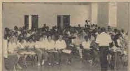
Participantes da Clínica de Comunicação realizada nos dias 11 e 12.10.91, no Instituto Bíblico Batista, em F. de Santana.

Foram gratificantes os estudos realizados na Clínica de Comunicação nos dias 11 e 12 de outubro de 1991, nas instalações aprazíveis do Instituto Bíblico Batista do Nordeste, em Feira de Santana.