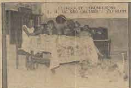
Movida pela Clínica de Comunicação dos dias 11 e 12/10/91 em Feira de Santana, A Igreja realiza sua Clínica interna.

Plantada no centro do bairro, a igreja vislumbra duas grandes verdades acerca da posição que Deus lhe deu: O privilégio do cuidado de Deus em conceder-lhe tal localização e o desafio de estar no coração do gigante São Caetano, que mais parece uma pequena cidade, dentro de Salvador, por sua extensão populacional e territorial com sua realidade de carências de toda sorte e a lamentável ausência de Deus na vida do homem. Ainda há muito a ser feito pelo Deptº de Multiminstério e pelo Centro Batista Comunitário Pr. José Jacinto da Silva (este último criado há 5 "cinco"