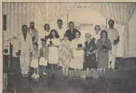
Membros da Frente Missionária em Iraquara