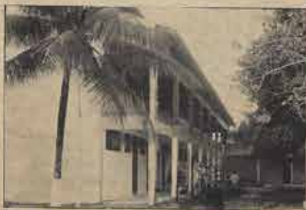
Prédio novo construído para Biblioteca e salas de aulas do Instituto.

O IBBN, em Feira de Santana, está ampliando, de modo significativo, as suas instalações. O primeiro novo está em fase de acabamento para o funcionamento de uma espaçosa Biblioteca (com diversas estantes equipadas com bons livros e mesas para estudo). A Biblioteca, na parte térrea do novo prédio já está funcionando com o necessário equipamento. O