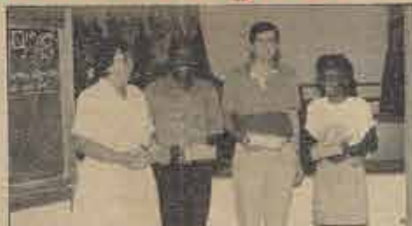
Professores da Clínica de Comunicação recebendo lembranças da Junta Executiva Baiana.

O estudo sobre Comunicação Musical foi bastante motivado. Houve muita participação do grupo. O palestrante deu muita ênfase sobre a necessidade de transmitir corretamente a mensagem musical. Ensinou também que o culto é