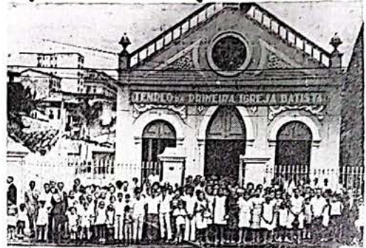
Fachada do Templo da Primeira Igreja Batista da Bahia.