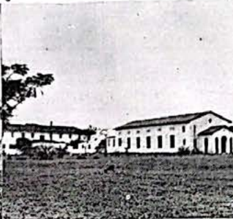
Feira de Santana, Bahia. Instituto Bíblico Batista do Nordeste. Internato Feminino (à esquerda), torre d'água e Salão Nobre.