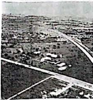
Feira de Santana, Bahia. (De avião) — Sitio do Instituto Bíblico Batista do Nordeste