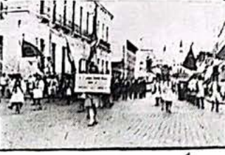
A Mocidade Batista Bahiana deu todo apoio ao desfile da Campanha das Américas — tarde do dia 12 de julho — último dia da Convenção.