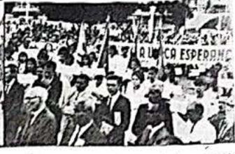
Aspecto da concentração organizada e dirigida pela Mocidade Batista Bahiana na tarde do dia 12 de julho (último dia da Convenção)