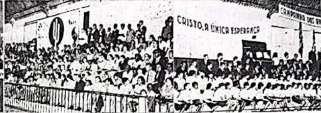
Parte do auditório no Ginásio Péricles Velozes, Coral do Instituto Bíblico Batista do Nordeste, Feira de Santana.