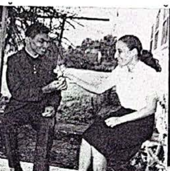
Feira de Santana, Bahia. Instituto Bíblico Batista do Nordeste. A vida social é parte importante nas atividades dos alunos.