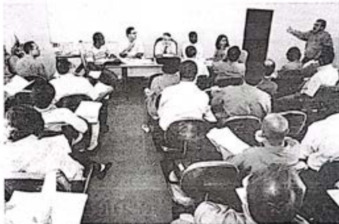
A última reunião do Conselho foi marcada por importantes decisões

O STBNe conseguiu, junto à Visão Mundial, apoio para a publicação da revista teológica EPISTÊME.