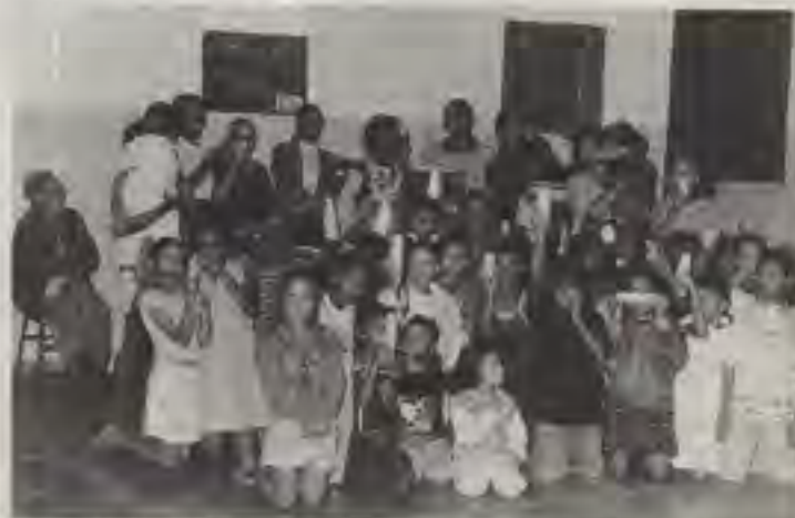
O festival do milho foi um grande sucesso e atraiu muitas crianças e adolescentes