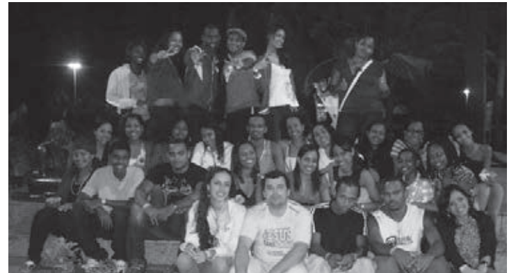
Jovens baianos e sergipanos no Acampamento