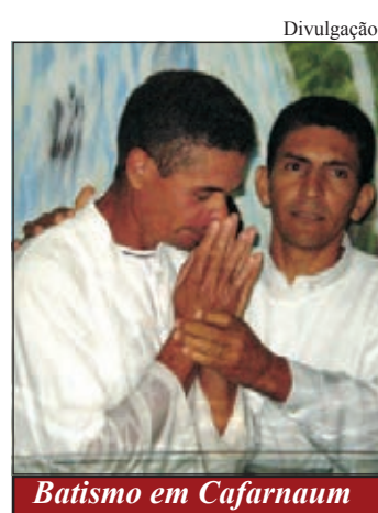
Batismo em Cafarnaum

ANIVERSÁRIO II – Em 15 de novembro de 1939, foi iniciado o trabalho da PIB de Ilhéus. Setenta anos depois, a igreja realizou uma série de