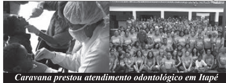
Caravana prestou atendimento odontológico em Itapé