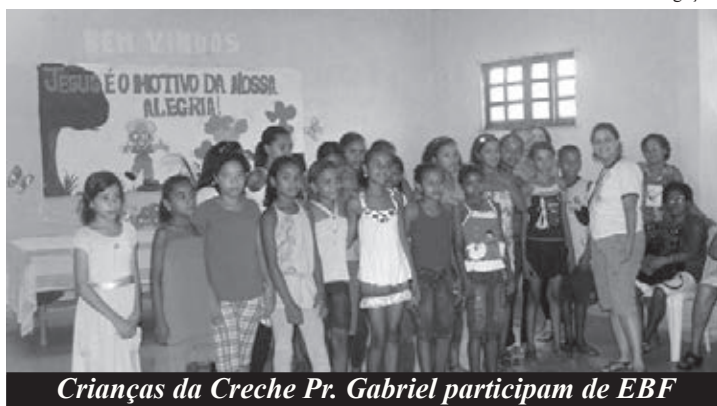
Crianças da Creche Pr. Gabriel participam de EBF