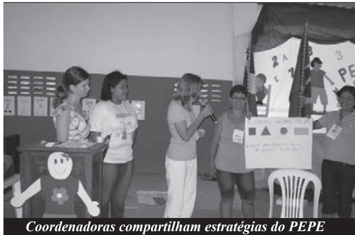
Coordenadoras compartilham estratégias do PEPE

Divididos em grupos, os coordenadores encenaram situações de risco enfrentadas por