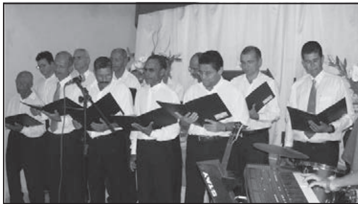
O culto de Missões contou com apresentação do coral