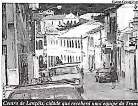
Centro de Lençóis, cidade que receberá uma equipe da Trans

Confira ao lado a lista de cidades que receberão equipes da Trans Chapada Diamantina e carecem de nossas orações desde já. Abaixo, entenda como funcionam as equipes de voluntários que farão diferença na região da Chapada.