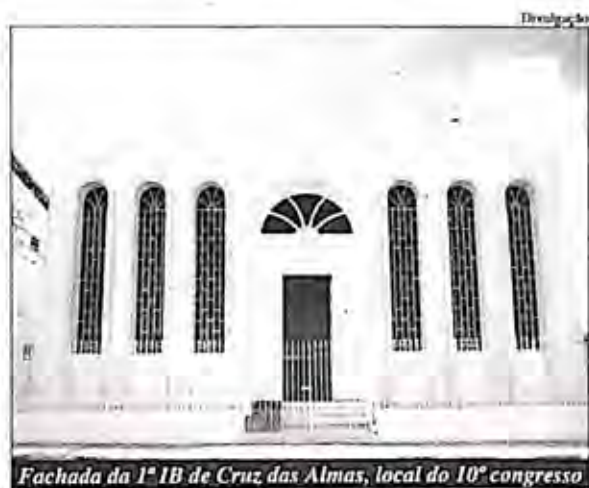
Fachada da 1ª IB de Cruz das Almas, local do 10º congresso

Para hospedagem, a organização do evento indica a Pousada Planalto – (75) 3621-0087 – e a Pousada do Sol – (75) 3621-1967. Haverá também a opção de hospedagem econômica nas instalações da igreja.