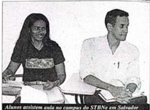
Alunos assistem aula no campus do STBNe em Salvador

O campus do Seminário em Feira de Santana, instalado em uma área de 400 mil metros quadrados, abriga uma capela para