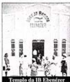
Templo da IB Ebenézer