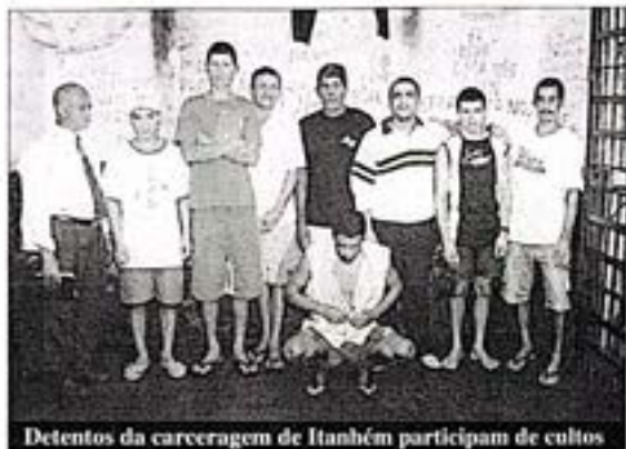
Detentos da carceragem de Itanhém participam de cultos