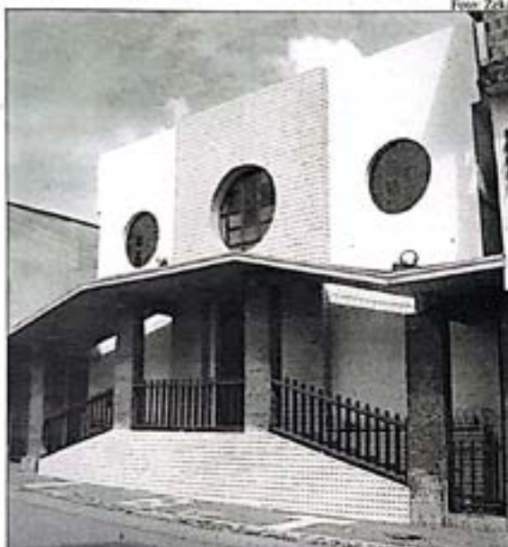
Fachada do templo da IBTeosópolis, sede da 84ª Assembléia

A capacitação da liderança das igrejas será a grande novidade da 84ª Assembléia Anual da Convenção Batista Baiana. O evento acontecerá em Itabuna, de 26 a 30 de junho de 2007, recebido pela Igreja Batista Teosópolis.