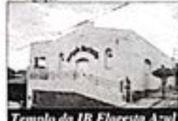
Templo da IB Floresta Azul