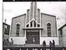
Templo da IB de Ibicaraí