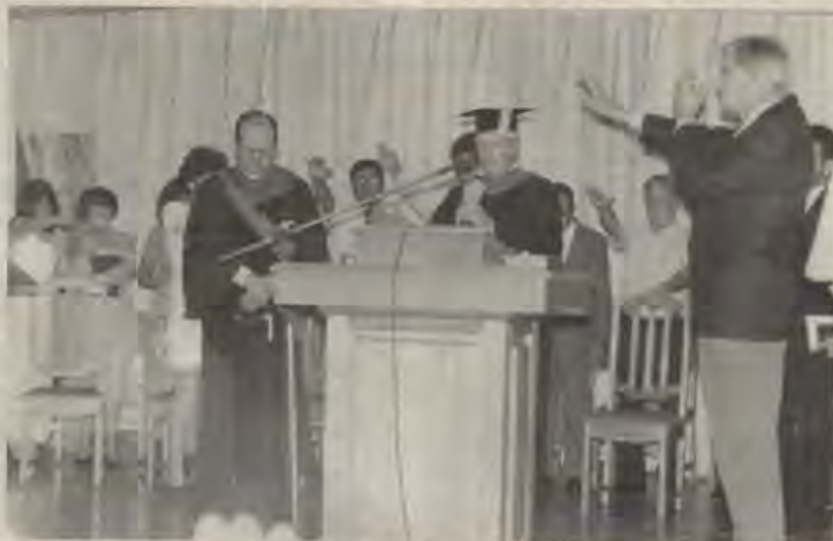
A posse solene do reitor foi um dos momentos mais marcantes do culto