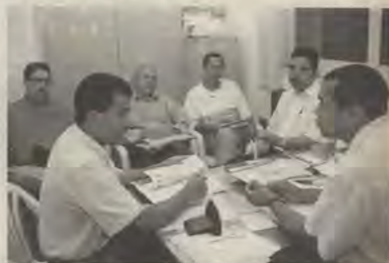
A Coordenadoria de Administração aguarda os orçamentos dos órgãos e entidades

problemas no sistema do Banco do Brasil, houve um atraso na geração dos boletos. Conseguimos imprimí-los e enviá-los para as igrejas. O próximo passo será a impressão, no banco, em forma de carnê, para todos os meses do ano, Missões Estaduais e convênios missionários.