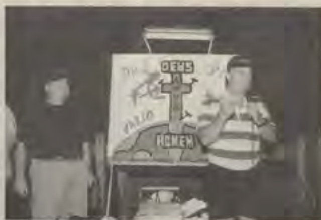
As mensagens ilustradas atraíram muita gente

A técnica de mensagem ilustrada, sistema que consiste em levar a mensagem do evangelho através de pintura com tinta fluorescente sob foco de luz negra foi praticada em seis pontos fixos. Enquanto a mensagem ia sendo narrada, o artista/evangelista pintava o quadro, atraindo muitos curiosos.