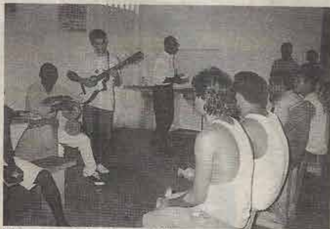
Dois congregações funcionam na PLB

Além da evangelização, os missionários realizam trabalhos sociais, como a promoção de cursos de alfabetização, pintura em tecido, cabele-