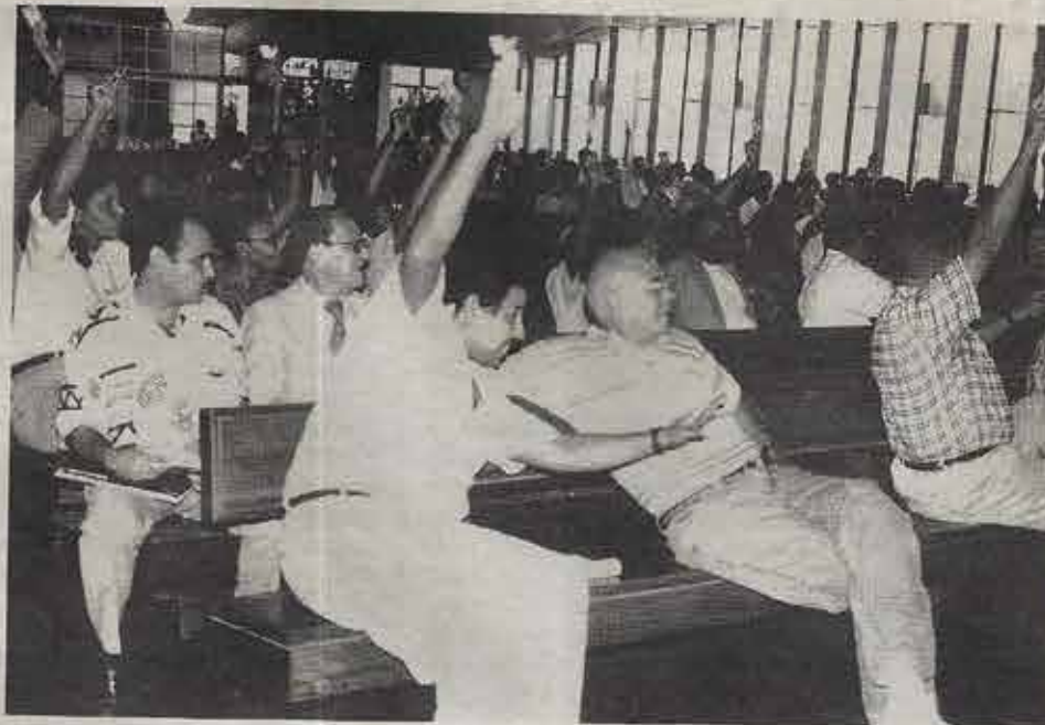
Nas igrejas batistas decisões são tomadas em assembleias