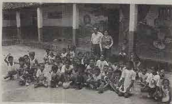
A creche em Esplanada precisa de ajuda