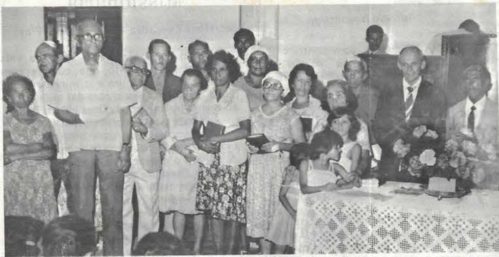
Irmãos que foram acidentados no desenvolvimento do teto da 2ª Igreja B. de Alagoinhas — 9/3/80.