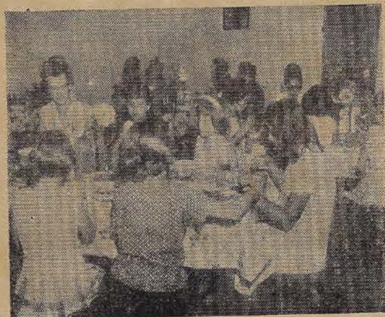
Aspecto do Refeitório do Acampamento das Mensageiras do Rei — em Jaguaquara

(Parecer aprovado pela Junta Geral da C. B. Bahiana, em 4-2-64)