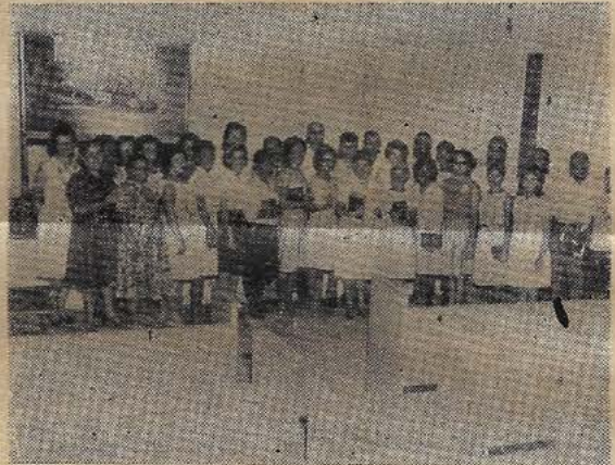
Conselheiras e Conselheiros das Mensageiras e dos Embaixadores do Rei Acampamento de 1964