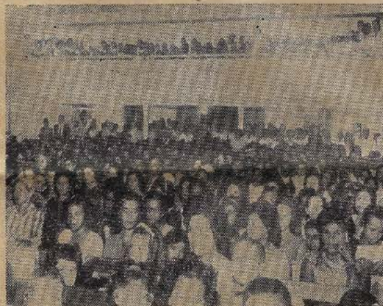
Vista parcial do Auditório que assistiu a última noite do Acampamento