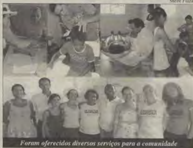
Foram oferecidos diversos serviços para a comunidade