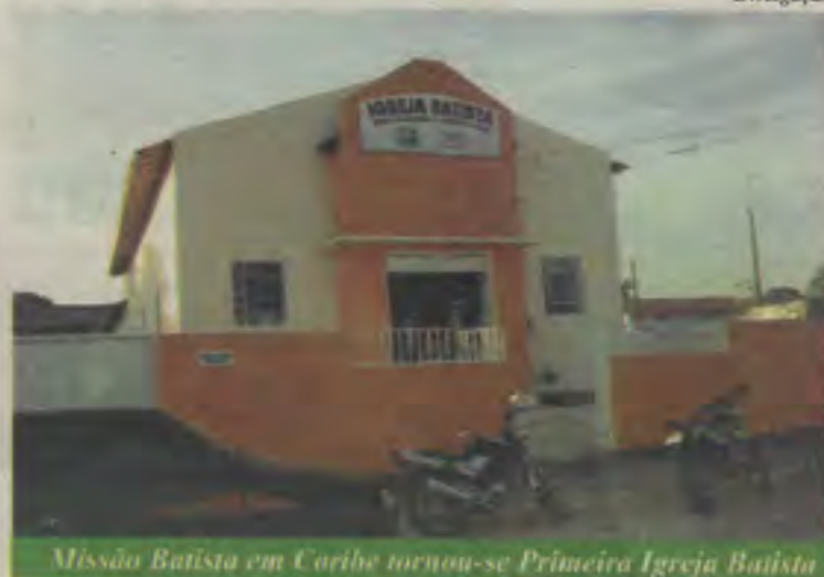
Missão Batista em Coribe tornou-se Primeira Igreja Batista