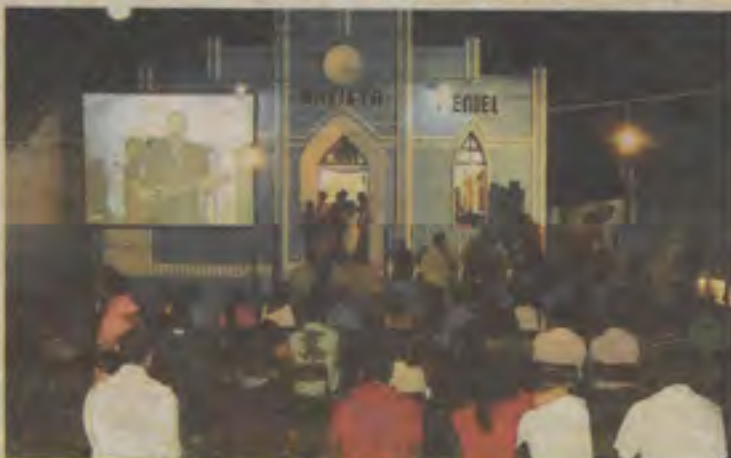
IB Peniel celebrou aniversário com muito louvor a Deus

PARA CRIANÇAS - Indicado para crianças pequenas, o mini livro temático Jesus Vive conta o emocionante episódio da Páscoa. Com o auxílio de cinco quebra-cabeças, o leitor mirim poderá conhecer a história da ressurreição de Jesus e interagir com a narrativa. Ilustrações cativantes e linguagem simples tornam essa publicação ideal para a criança iniciar o contato com a Palavra de Deus. Mais informações: Sociedade Bíblica do Brasil, 0800-727-8888.