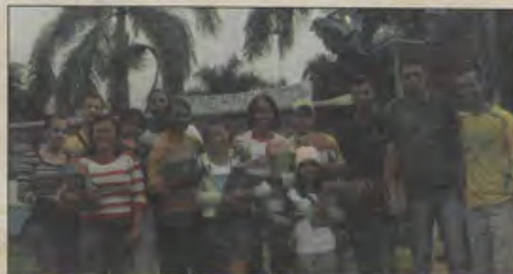
Equipe que evangelizou na Mini Trans em Barra da Estiva

ANIVERSÁRIO - A IB Peniel, em Dário Meira, celebrou nos dias 3, 4 e 5 de abril o seu 34º aniversário de orga-