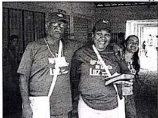
Caravana inspira-se na campanha de Missões Mundiais