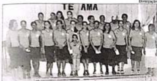
Caravana inspirou-se na campanha de Missões Mundiais