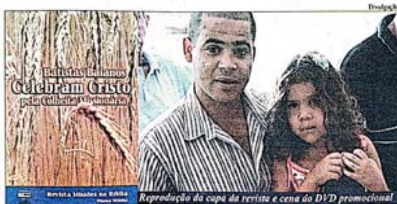
Reprodução da capa da revista e capa do DVD promocional

Igrejas que não são sistematicamente e enfaticamente ensinadas acerca da sua responsabilidade no preparo, envio, sustento de obreiros, abertura de campos pioneiros e na propagação missionária acabam produzindo um gênero de cristãos enaltecidos consigo mesmos, problemáticos e infrutíferos. São igrejas que giram em torno de si mesmas tornando-se estagnadas em poucos anos.