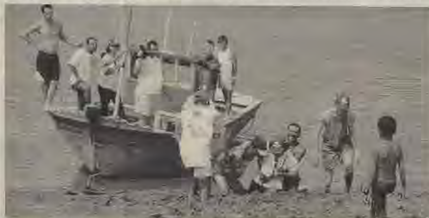
O acesso às vilas é sempre muito difícil e perigoso. A lama pode chegar até a cintura

Como não poderia ser diferente, o trabalho tem dado frutos e crescido. Várias pessoas estão entregando-se ao Senhor Jesus e tendo suas vidas transformadas pelo poder do Espírito Santo de Deus.