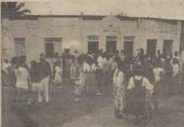
Missão Batista em Cairu, após a realização da cerimônia de seis casamentos.

No dia 25 de junho de 1994, a Frente Missionária, em Cairu, realizou importantes atividades evangelísticas. No culto do domingo, pela manhã, o Pr.