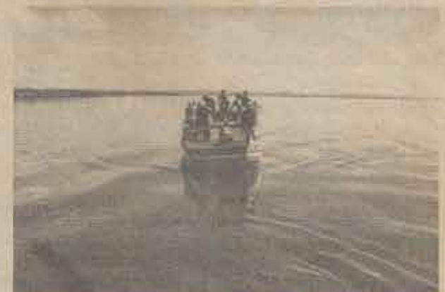
Barco da Convenção Batista Baiana, dirigindo-se para a Ilha de Tapúias.

Esta Missão Batista entre Pescadores é mantida pela Convenção Batista Baiana em convênio com a Igreja Batista Redenção de Salvador.