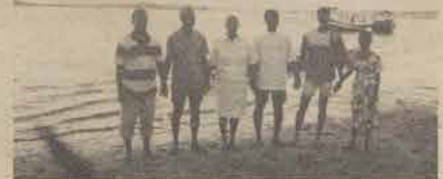
Realização de 6 batismos de novos irmãos na Ilha de Tapúias. (Faltando um na foto).

O redator de "O Batista Baiano" sentiu muita alegria em poder participar das realizações vitoriosas do dia 25/06/94, em Cairu e adjacências.