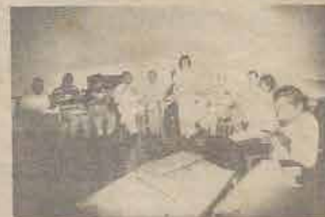
Um dos grupos de Pastores participantes do Encontro.

Algumas das matérias estudadas foram: Discipulado e Crescimento, Como analisar nosso Crescimento, Pesquisas no Livro de Atos, Radiografia da Igreja, Biblioteca Básica do Pastor, Plantação de Igrejas, Recursos Didáticos, e Dons do Espírito Santo, além de estudos de avaliação.