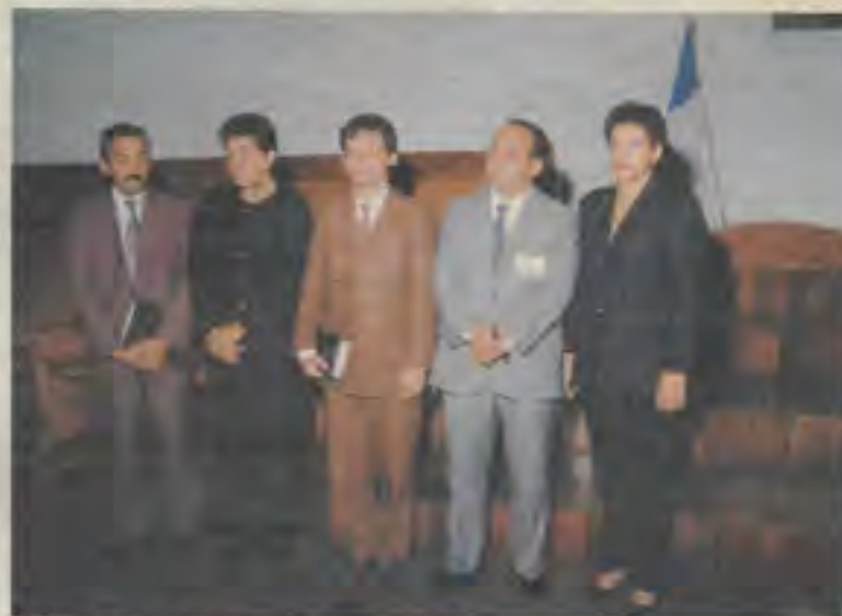
A nova diretoria foi empossada na última noite