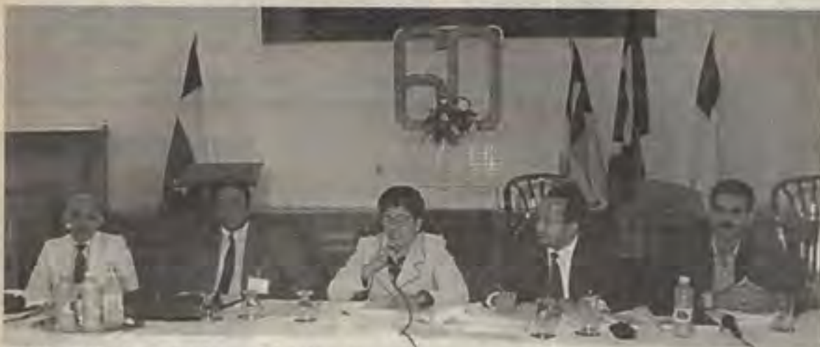
A 76ª Assembléia foi marcada pela tranquilidade das sessões.