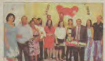
Casaiais de Rafael Jambeiro

CASAIS – A cada mês de junho, a Congregação da IB Monte das Oliveiras, em