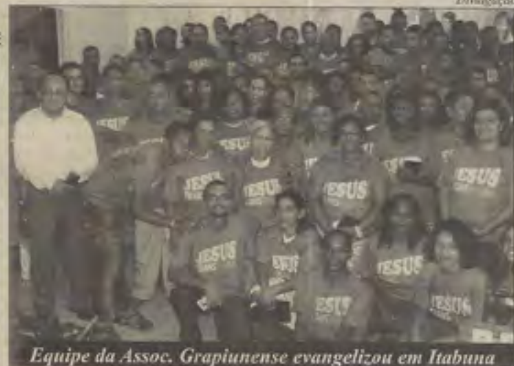
Equipe da Assoc. Grapiunense evangelizou em Itabuna

A colheita na noite de domingo (29) foi um presente de Deus para a IB de Ferradas, que recebeu um grande desafio: realizar estudos bíblicos nos lares de 148 famílias onde houve 91 decisões e quatro reconciliações, resultado da Trans. Durante a ação missionária, foram realizadas ainda 433 aferições de pressão arterial, 176 cortes de cabelo, 174 testes de glicemia, 65 atendimentos clínicos, um atendimento psicanalítico, 76 aplicações de flúor, 25