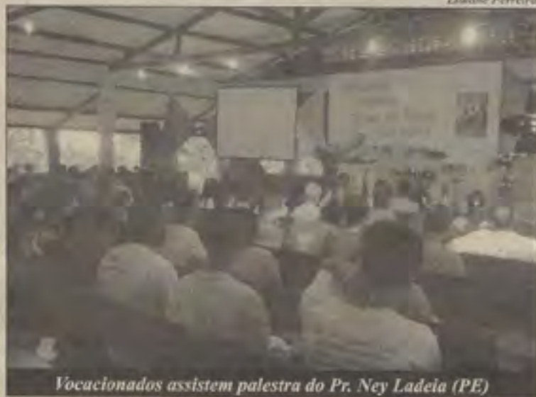
Vocacionados assistem palestra do Pr. Ney Ladeia (PE)

Mais de 330 pessoas, representando 78 igrejas, estiveram reunidas entre os dias 15 e 17 de maio no Acampamento para Vocacionados 2009, no Centre, em Barra do Pojuca. Promovido pela Gerência de Missões da Convenção Batista Baiana (CBBa), o evento contou com a presença de muitos jovens e reuniu pastores, missionários, promotores de missões, dentre outros.