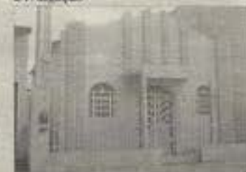
Templo da PIB em Seabra