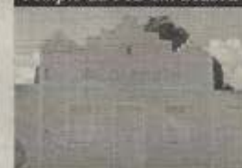
Templo da PIB Ibotirama