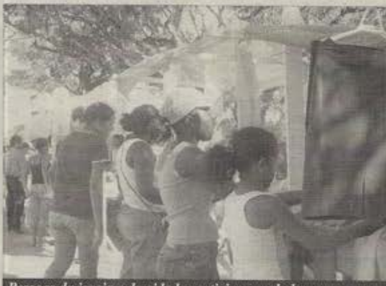
Pessoas da igreja e da cidade participaram do bazar na praça