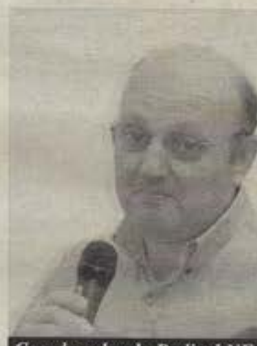
Coordenador do Radical NE

do pela Junta de Missões Mundiais, com equipes enviadas para a África e América do Sul, e a Junta de Missões Nacionais também adotou o modelo.