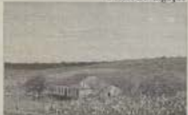
Área do futuro acampamento

estes: direção de Deus, oportunidade, fé, parecer de técnicos, valor agregado do imóvel, principalmente pela proximidade de água em abundância, e o desejo unânime da própria igreja. Agradecemos a Deus por mais essa bênção e pedimos, principalmente aos irmãos batistas, que orem ao Pai de infinita e excelsa bondade para que Ele mesmo nos ajude na glorificação do Seu nome, através da mordomia fiel de todos os Seus bens.