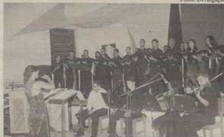
No recital, a regente comanda o desempenho de todo o grupo

Outro importante critério da avaliação é que a regência deve ser coerente com o estilo musical da peça escolhida. No repertório do recital da seminarista, por exemplo, estiveram presentes os estilos renascentista, barroco, clássico, romântico e contemporâneo. Com o auditório repleto, foram interpretados compositores eruditos, como