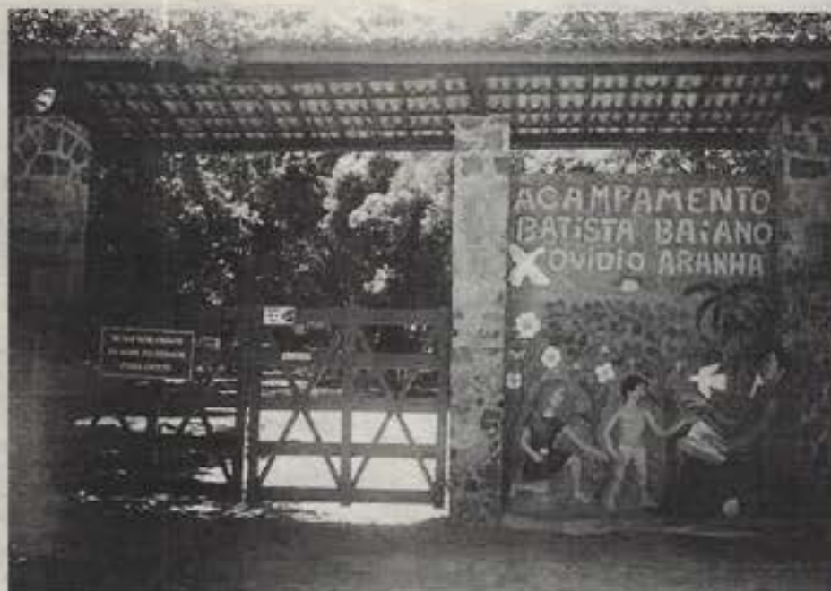
O controle rigoroso do acesso dá mais segurança aos acampantes

Um grupo coordenado pela IB de Plataforma ocupou o galpão de cima, enquanto no auditório junto à piscina aconteceram as reuniões pilotadas pelos pastores Ironilson de Jesus Barbosa de Monte Carmelo, o Silvio