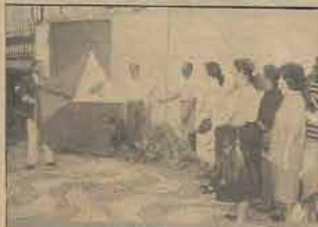
Hasteamento da Bandeira da Escola Kate White no dia 23/3/92.

Houve um movimento inusitado no pátio da Escola Kate White na tarde do dia 23 de março corrente, quando foi realizada a solenidade do hasteamento da Bandeira da Escola.