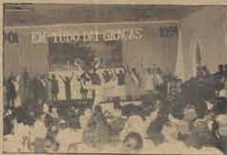
Apoteose apresentada pelos jovens da Primeira Igreja de Jequié.