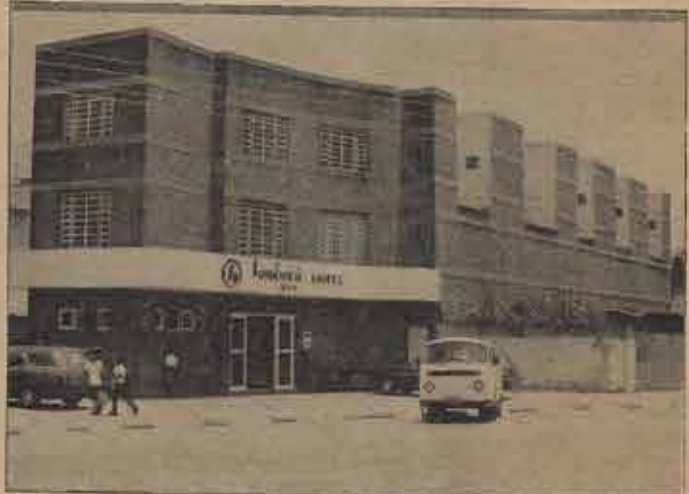
Fachada do Samburá Hotel de Feira de Santana.

A Primeira Igreja Batista de Feira de Santana hospedará nos dias 3 a 7 de julho próximo a Convenção Batista Baiana para a realização de sua 69ª. assembléia anual.