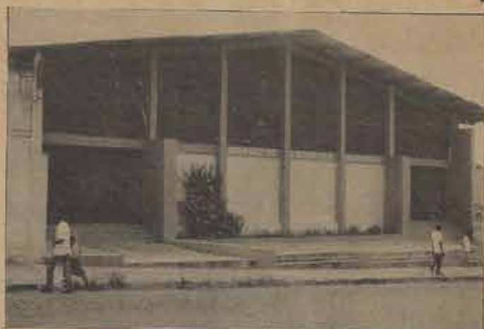
Ginásio de Esportes Municipal de Feira, local das reuniões noturnas e hospedagem econômica da 69ª. assembléia convencional.