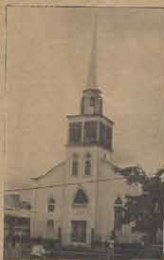
Fachada do Templo da Primeira Igreja Batista de Feira de Santana.