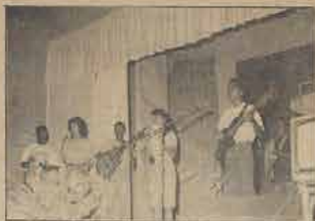
Conjunto Gotas Vivas, apresentando músicas de elevada inspiração no Acampamento de Jaguaquara.