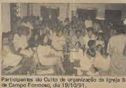
Participantes do Culto de organização da Igreja B. de Campo Formoso, dia 19/10/91.