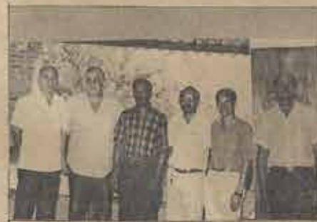
Nova diretoria da Ordem dos Pastores da Bahia eleita por ocasião do Retiro Anual, no dia 13/2/92.