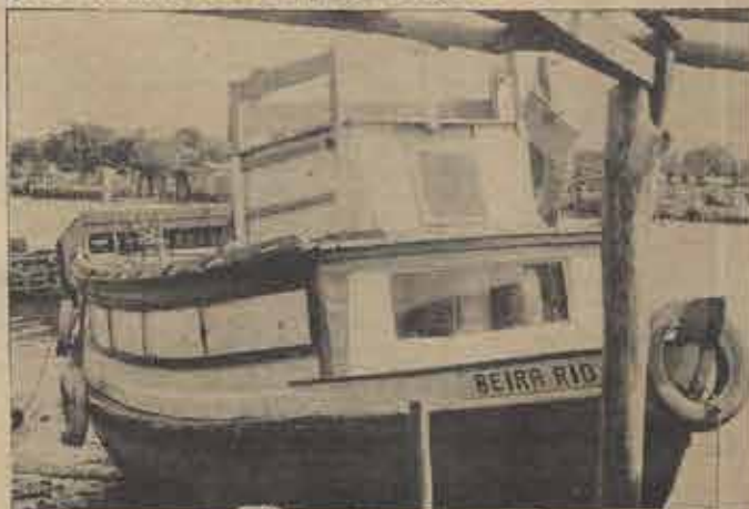
Barco adquirido para evangelizar pescadores.