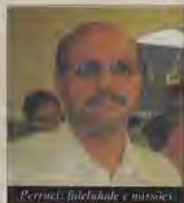
Perruci: fidelidade e missões.

Noite missionária foi um dos pontos altos do Acampamento Geral