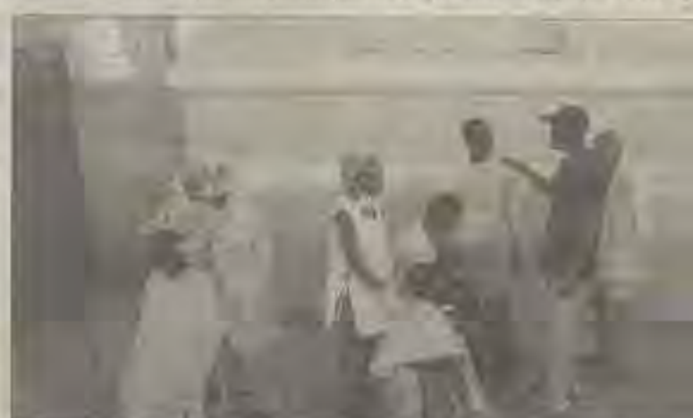
Corte de cabelo e evangelismo pessoal, são algumas das ações sociais. Pálcio, anualmente na Praça Municipal para receber a população de rua.

A Ceia tem uma equipe de coordenação, que distribui responsabilidades entre todas as outras equipes: preparação espiritual, ornamentação, som, limpeza, serviço de mesa, discipulado, segurança, ação social, divulgação e misericórdia. Reuniões periódicas e de muito empenho contribuem para que tudo se realize a contento. Madrugadas com Deus está em recesso e deve voltar a acontecer na penúltima sexta-feira do mês de março de 2006. Mais informações, pelo (71) 3247 1079.