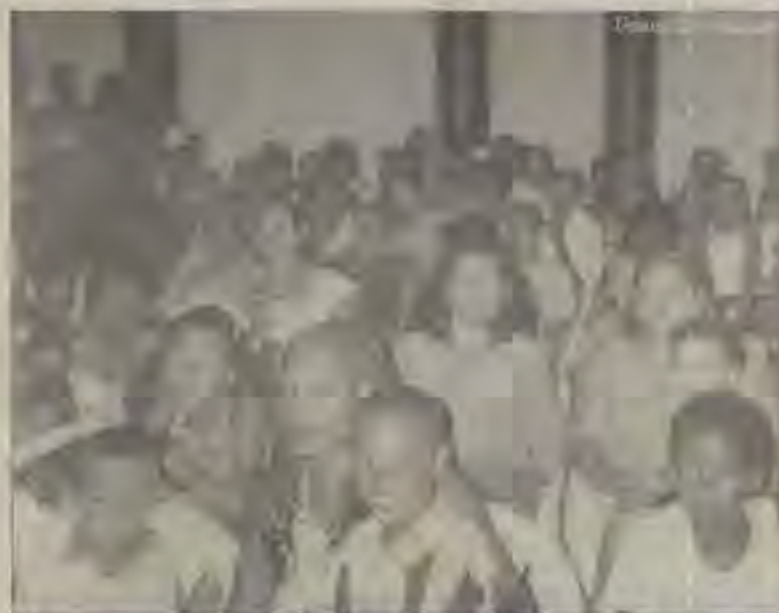
Morro da COCISA: comunidade tem prestigiado a nova congregação

ALAÍDE SILVA BEM-QUE-DEJA-RELEGIADA/LIA JIM