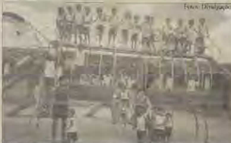
Pequenos brincam em parque infantil no pátio da Creche Pr. Gabriel

As notas e cupons fiscais emitidos entre janeiro e abril de 2006 serão muito bem-vindos à Creche Pastor Gabriel, mantida pelo povo batista da Bahia na cidade de Esplanada. Os comprovantes de serviços e compras feitas nos primeiros quatro meses do ano serão revertidos em benefício da entidade filantrópica através do programa Sua Nota É Um Show, do governo estadual.