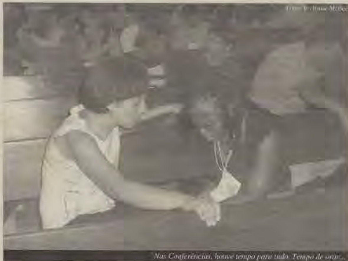
Nas Conferências, houve tempo para tudo. Tempo de orar...