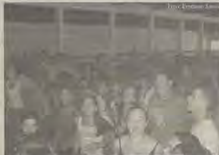
Paraso: jovens do Nordeste mostram sua alegria durante louvor

mesmo período do Conjubano, mas com um tempo um pouco maior de duração, aconteceu o Acampamento da Juventude Batista de Salvador (JBS). Durante quatro dias, de 11 a 15 de novembro, cerca de 220 jovens passaram pelo Centro de Treinamento Batista Ovidio Aranha (Centre), em Barra de Pojuca.