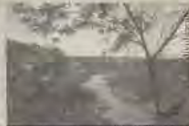
Um dos vales do São Francisco

A cidade atualmente recebe o Eco Esportes Radicais, evento que agrupa