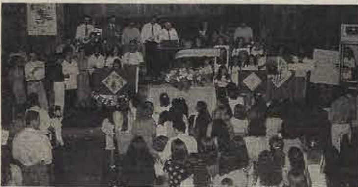
O culto de ação de graças foi muito concorrido

Representantes dos Gideons Internacionais estiveram presentes nessas reuniões e distribuíram a alunos, professores e funcionários, exemplares do Novo Testamento com Salmos e Provérbios.