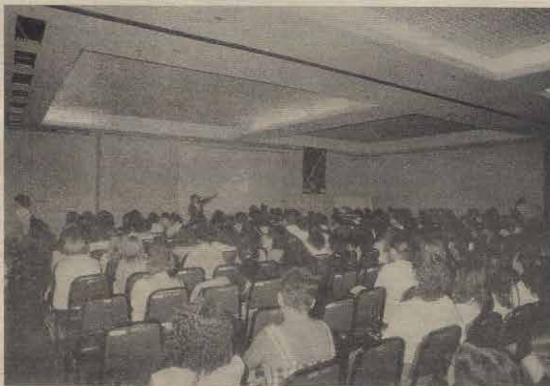
O Centro de Convenções será palco do grande encontro dos batistas

Leia mais nas páginas 4 e 5 e confira as dicas sobre Salvador.