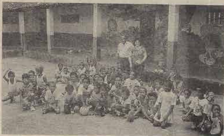
Crianças são cuidadas e evangelizadas pelos missionários