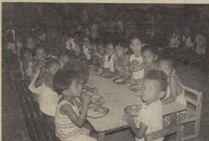
As crianças agora têm esperança