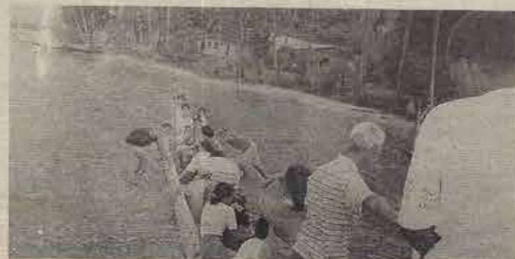
O único acesso à vila é pelo mar

A vila de Tapuias é de difícil acesso porque não tem ponte para o desembarque. O transporte de passageiros tem de ser feito de canoa e esse é um dos desafios que a missionária terá de enfrentar. O barco "Semeador da Paz" só pode chegar até um