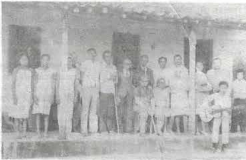
Onze novos decididos da Igreja de Olindina.