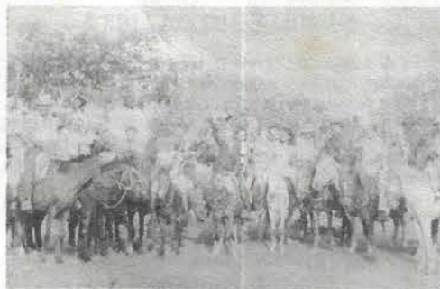
Caravana Batista em Brejo do Meio.