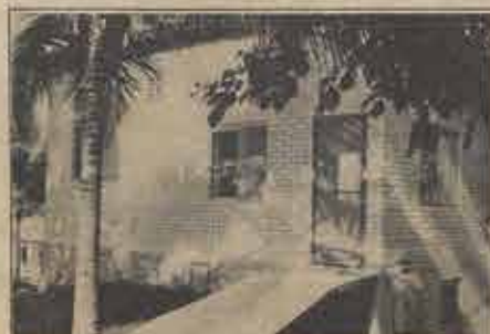
Atualmente ocupada pelo diretor do CENTRE, esta casa terá uma "irmã gêmea" pronta até o final deste ano. Faça sua reserva com antecedência pois há muitos pedidos!

As casas têm um bom acabamento, com a cozinha e o banheiro azulejados, piso de cerâmica em toda a casa, paredes de tijolinho apa-