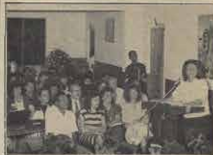
Acampamento da SM e SFM Rionovense.