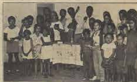
Culto realizado na antiga terreiro de Candombê em Nova Soure.