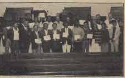
Participantes do III Seminário do PNE, realizado em Vitória da Conquista.