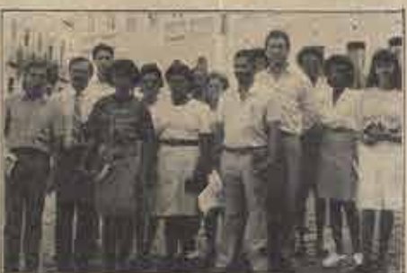
Participantes de uma concentração evangelística realizada no "Pelourinho" reunindo representantes de várias Igrejas de Salvador.

A liderança do trabalho, no "Pelourinho", está solicitando uma ajuda financeira