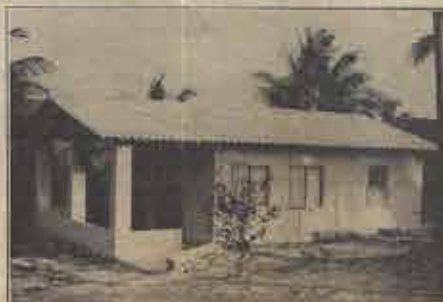
A "vila dos pastores" terá cinco casas, cada uma com um desenho diferente. A casa aqui já está pronta para pastores ou missionários passarem suas férias, alguns dias de descanso ou até uma lua de mel.

Estão em construção as casas pastorais no Centro de Treinamento Batista Baiano "Ovidio Aranha" (CENTRE). Uma casa já se encontra pronta para pastores e missionários passarem as suas férias, alguns dias de descanso ou até uma lua-de-mel. Mais duas casas estarão prontas até o final deste ano.