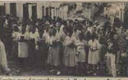
Equipe que desenvolve o trabalho de evangelização no "Pelourinho".

A Super Clínica do PNE, Pólo Salvador, foi realizada em Vitória da Conquista no dia 24 de agosto de 1991, logo após as atividades do III Congresso Estadual. O encontro reuniu diversos participantes, representando expressivo número de Igrejas do Campo Baiano. O resultado dos estudos ministrados a cinco grupos de interesse, foi altamente gratificante. (página 4).