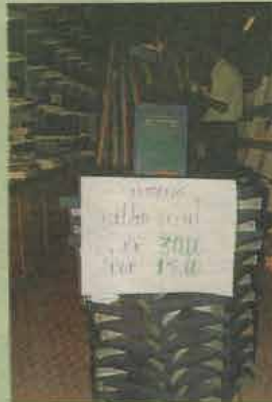
Livraria Crescer apresenta uma grande quantidade de livros, bíblias e CDs

O endereço é: Rua Visconde de São Lourenço, 6, Campo Grande - Salvador-Ba.