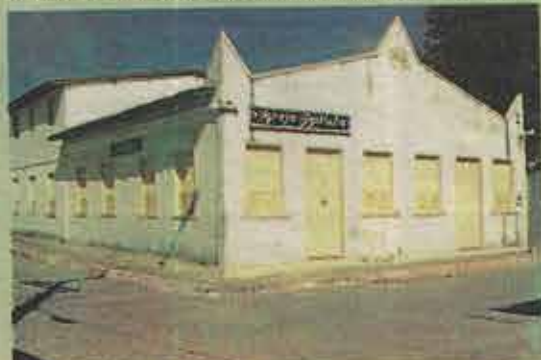
Fachada do templo, tombado pelo Patrimônio Histórico

O Autor é pastor da Primeira Igreja Batista em Santa Cruz Cabrália, BA.