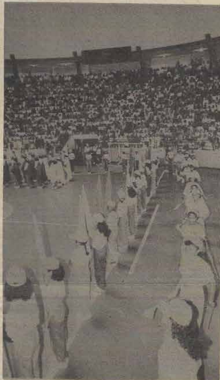
O Balbininho será novamente lotado pelos batistas.

Nesta edição, nas páginas 6 e 7, está publicado o projeto de estatuto e mudanças que serão discutidas, para que possa haver um conhecimento amplo e antecipado. Para esclarecer qualquer dúvida, a primeira parte da 3ª Assembleia Extraordinária, das 9 às 12 horas, será dedicada a debates sobre a reforma, ficando a votação propriamente dita para a sessão da tarde, a partir das 14 horas.