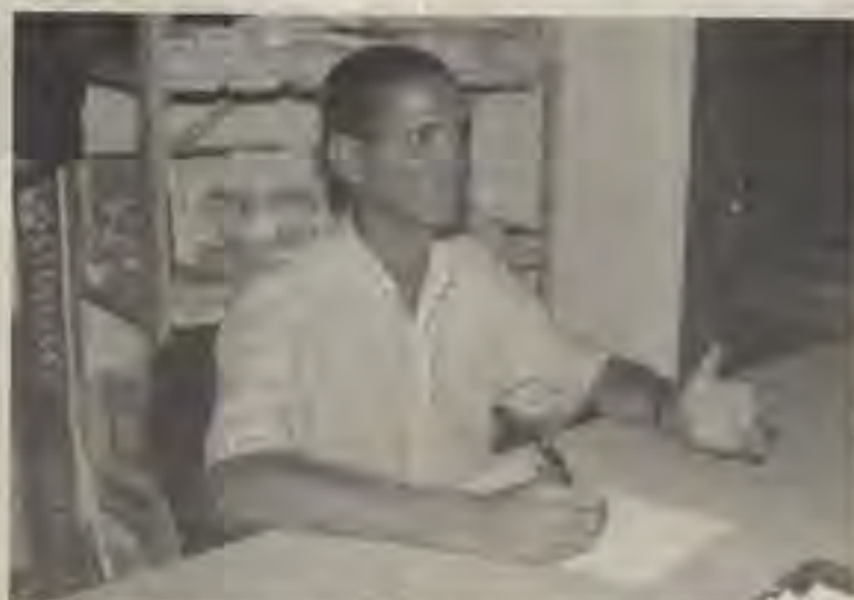
Secretário escolheu sua equipe de trabalho.