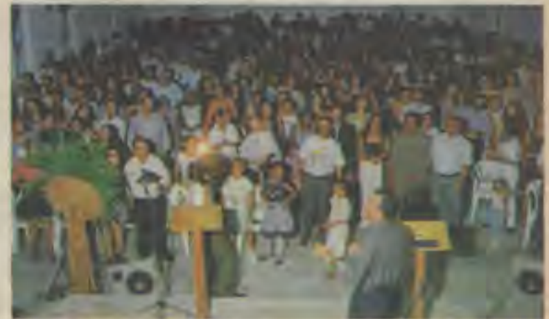
O Conjubahsul reuniu mais de 1.500 jovens