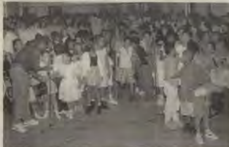
A igreja evangeliza e amplia o número de membros