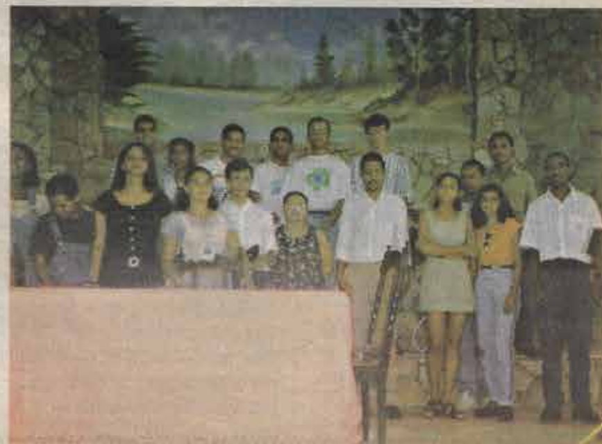
Nova Diretoria do ABAR-98 - Congresso dos Adolescentes da Associação Rionovense