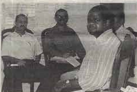
O concílio reuniu muitos pastores.