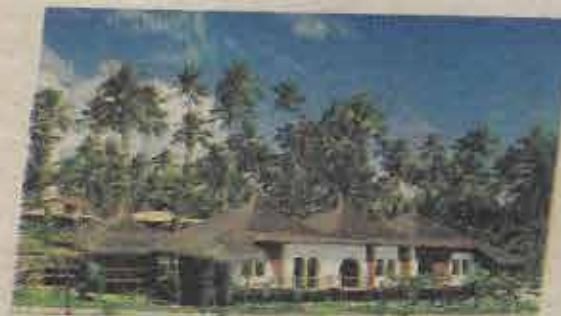
Centro de convenções com moderna infra-estrutura de equipamentos, serviços e sala de apoio.

O valor da inscrição é de R$ 30,00 reais ou 03 (três) parcelas de R$ 12,00 através de cobrança bancária e dará direito a pasta especial do congresso, guia do congressista, livro de cânticos, camisa do congresso e vários outros brindes.