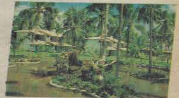
Apartamentos aconchegantes, todos com vista para o mar.

Para maiores informações, utilize a ficha abaixo e remeta-nos ainda hoje, ou ligue para o telefone (071) 245-6211.